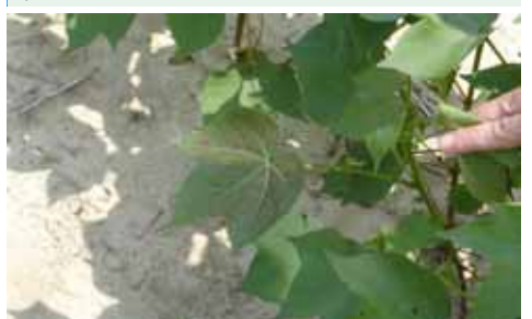
Symptômes de carence en phosphore (coton)