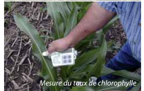
Mesure du taux de chlorophylle