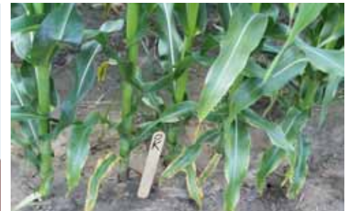
Symptômes de carence en potassium (maïs)