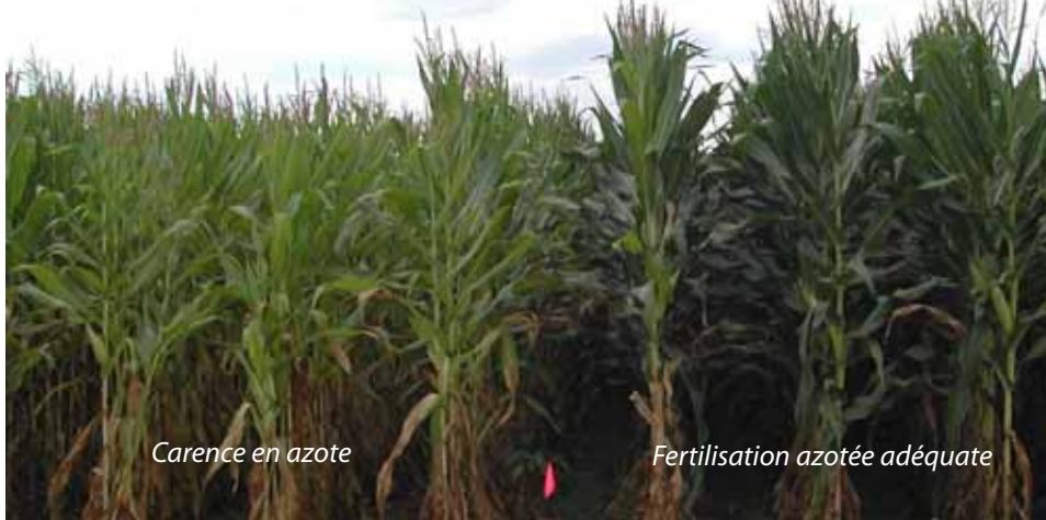
Carence en azote