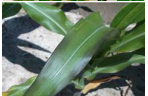
Symptômes de carence en phosphore (maïs)