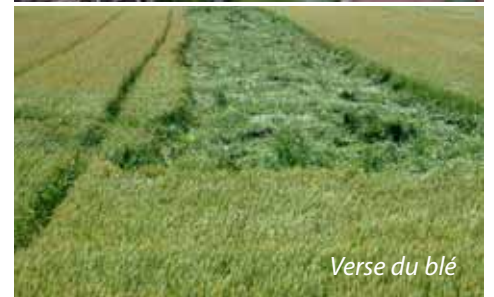
Verse du blé