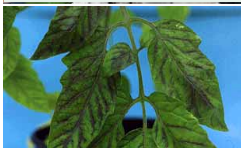
Symptômes de carence en phosphore (tomate)