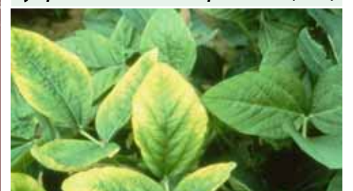
Symptômes de carence en potassium (soja)