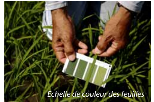
Echelle de couleur des feuilles

Les quantités prélevées par les cultures dépendent des organes récoltés et exportés. Le tableau 3 donne les quantités totales d'éléments nutritifs prélevés par différentes cultures.